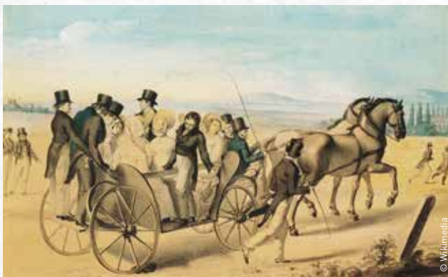
„Landpartie der Schubertianer von Atzenbrugg nach Aumühl“ von Leopold Kupelwieser, 1820