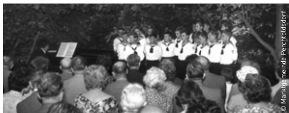
Hugo-Wolf-Serenade 1960 mit den „Sängerknaben vom Wienerwald“

Dem international gefragten Liedbegleiter, Komponisten und Pädagogen Erik Werba (1918–1992) ist es zu verdanken, dass insbesondere in den 70er und 80er Jahren einige der bedeutendsten Publikumsliebhaber der internationalen Opern- und Konzertpodien auftraten. Von Anfang an wirkten berühmte Sängerpersönlichkeiten mit – so etwa Christa Ludwig, Irmgard Seefried, Brigitte Fassbaender, Edita Gruberova, Kurt Equiluz, Anja Silja, Renate Holm und Walter Berry. Die Reihe der hochkarätigen Musizierenden setzt sich in der Gegenwart mit Interpret:innen wie Bo Skohvus, Ildiko Raimondi, Angelika Kirchschrager, Annette Dasch, Chen Reiss und Robert Holl fort. Die Serenadenkonzerte finden in erster Linie als Liederabende bzw. -matineen statt, manchmal ergänzt durch Intermezzi von namhaften Instrumentalist:innen oder Lesungen von Publikumslieblingen der heimischen Theaterbühnen sowie aus Film und Fernsehen.