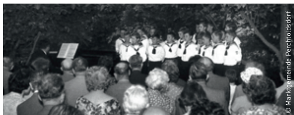
Hugo-Wolf-Serenade 1960 mit den „Sängerknaben vom Wienerwald“

Dem international gefragten Liedbegleiter, Komponisten und Pädagogen Erik Werba (1918–1992) ist es zu verdanken, dass insbesondere in den 70er und 80er Jahren einige der bedeutendsten Publikumsliebhaber der internationalen Opern- und Konzertpodien auftraten. Von Anfang an wirkten berühmte Sängerpersönlichkeiten mit – so etwa Christa Ludwig, Irmgard Seefried, Brigitte Fassbaender, Edita Gruberova, Kurt Equiluz, Anja Silja, Renate Holm und Walter Berry. Die Reihe der hochkarätigen Musizierenden setzt sich in der Gegenwart mit Interpretierenden wie Bo Skohvus, Ildiko Raimondi, Angelika Kirchschrager, Annette Dasch, Chen Reiss und Robert Holl fort. Die Serenadenkonzerte finden in erster Linie als Liederabende bzw. -matineen statt, manchmal ergänzt durch Intermezzi von namhaften Instrumentalistinnen und Instrumentalisten oder Lesungen von Publikumsliebhabern der heimischen Theaterbühnen sowie aus Film und Fernsehen.